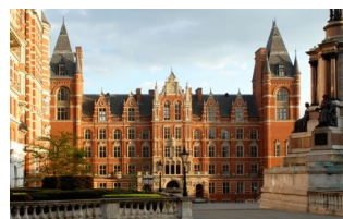
Royal College of Music

1889年に設立された英国王立音楽検定協会（アソシエテッド・ボード）では、世界最大規模の音楽検定を行っています。120年以上の歴史と伝統を誇るこの検定は、約90ヶ国で実施され、毎年約63万人以上が受検しています。日本で実施される検定では、英国王立音楽検定協会より派遣された音楽家、音楽指導者が審査にあたります。公益財団法人かけはし芸術文化振興財団では、日本代表事務局として検定の運営を行い、音楽教育水準の向上に努めています。