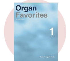
教材 “Organ Favorites” (山口綾規)