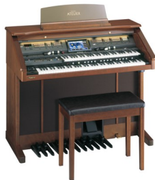
ミュージック・アトリエ AT-800