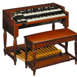
ハモンドオルガン XK-5