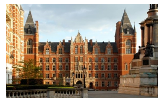
Royal College of Music

1889年に設立された英国王立音楽検定協会(アソシエイトド・ボード)では、世界最大規模の音楽検定を行っています。120年以上の歴史と伝統を誇るこの検定は、約90ヶ国で実施され、毎年約63万人以上が受検しています。日本で実施される検定では、英国王立音楽検定協会より派遣された音楽家、音楽指導者が審査にあたります。公益財団法人かけはし芸術文化振興財団では、日本代表事務局として検定の運営を行い、音楽教育水準の向上に努めています。