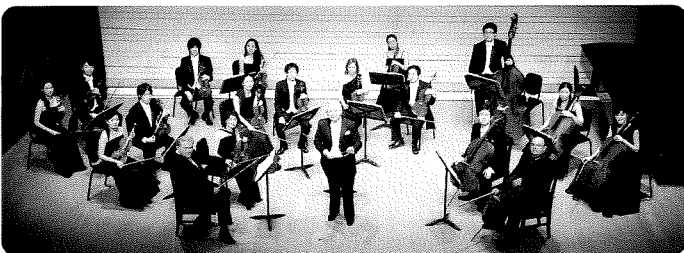
アーツ室内オーケストラ(Arts Chamber Orchestra)

桐朋学園大学、イーストマン音楽学校でヴァイオリンを学んだ後、指揮法をニューヨーク市立大学クイーンズ校にてモーリス・ペレスに指揮法を師事。またピエール・モントゥー・スクールにてマイケル・ジンボの下で研鑽を積んだ。2014年にニューヨークで室内オーケストラLucidity Chamberistasを設立し、コミュニティーに根差したオーケストラのあり方を模索する。2018年よりIMO New York協奏曲オーディションの指揮者を務めた。現在はアーツ室内オーケストラを指揮するほか、指導者として活動する。桐朋学園芸術短期大学講師。