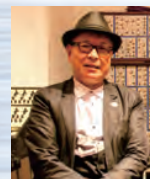
SYNTHESIZER 松武 秀樹