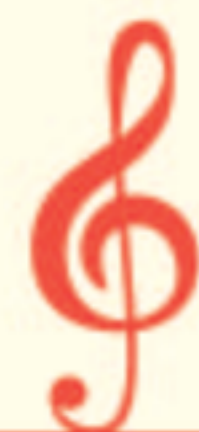
作・編曲 / オルガニスト 橋ゆり

群馬県前橋市出身。3歳よりクラシックピアノを始める。電子オルガンコンクールでの全国優勝後、TV番組「11PM」にて4年間ハモンドオルガン演奏。コロムビアレコードからアルバム「トロピカル・サイクロン」「マジカル・アイズ」、キングレコードからアルバム「Organ Chat」「Organ Chat 2」「Organ Chat 3」「Organ Chat 4」をレコーディング、リリース。また、幅広いジャンルでの執筆や作編曲、「Popular&Jazz 理論書」、オルガンアレンジ曲集出版多数。2009年日中韓3ヶ国「第4回日中韓観光大臣会合」にてオルガンコンサート。2011年には富田勲氏作曲による「源氏物語幻想交響絵巻」全曲の編曲と演奏を手がける。2013年「飛鳥IIオセアニアグランドクルーズ」にて初めての船上オルガンコンサート。現在「Organ Chat Concert」を全国各地で開催している。演奏活動は国内にとどまらず、アメリカ、ヨーロッパ各国、中国、東南アジア、ブラジルにもおよび、国際的な活動をするかたわら、レコード各社にてレコーディングアレンジャーとしても活動している。