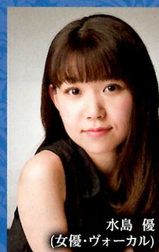
水島 優 (女優・ヴォーカル)